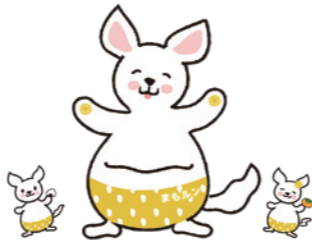
新潟県弁護士会 マスコットキャラクター まもルン・ハビ・ララ